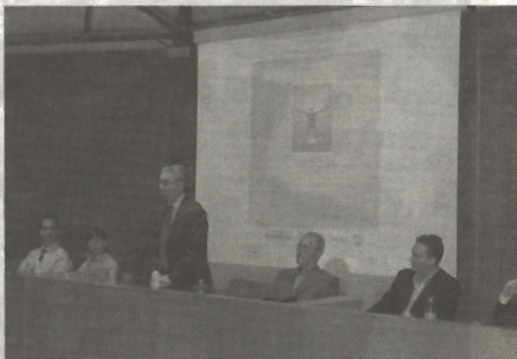
Un momento dell'incontro

biamo un carattere dell'innovazione per rispondere al mercato sempre più evoluto. Un mercato che richiede l'ottimizzazione dei tempi, l'economia della gestione, il risparmio di energia, la tutela ambientale e il miglioramento dei comfort abitativi". Per rispondere a queste esigenze occorre tecnologia ed innovazione. A susseguirsi sono state le relazioni dell'architetto Sergio Tinè su "Calce idraulica e pozzolana: tecnologia ed estetica per la moderna tutela del territorio urbanizzato"; l'ingegner Massimo Bocciolini con "Calcestruzzi speciali: l'esperienza Sc";