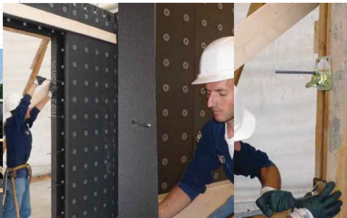
Ferri di aggancio