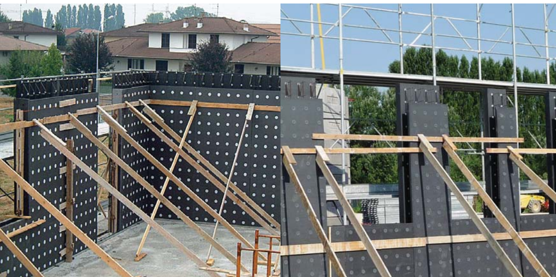
Pannelli accostati messi a piombo tramite puntelli diagonali uniti da una fascia continua inchiodata sui tappi del pannello.