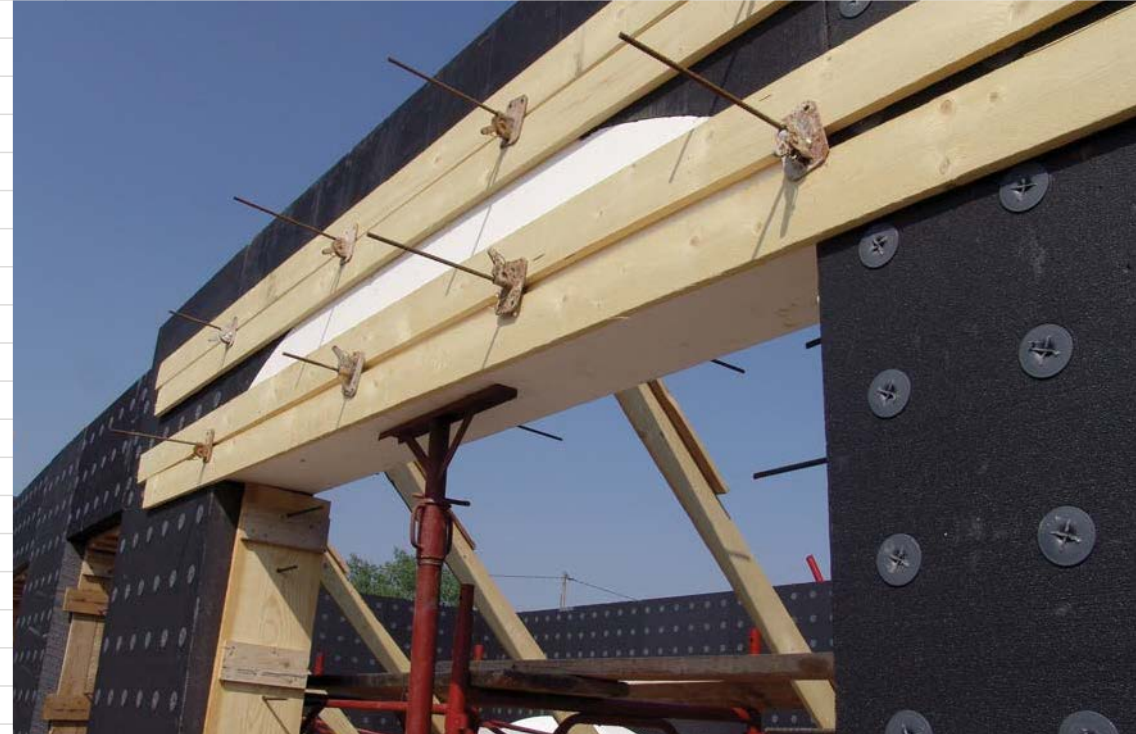
Casseri architravi a volto