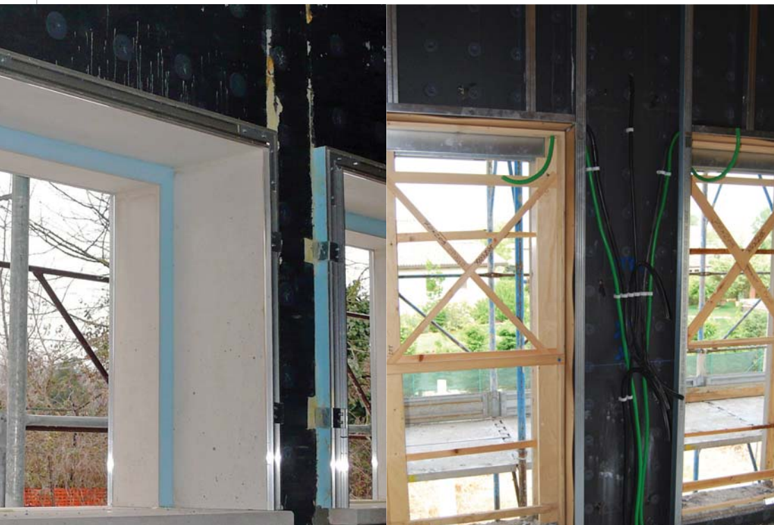
Falso telaio prefabbricato da montare prima del getto