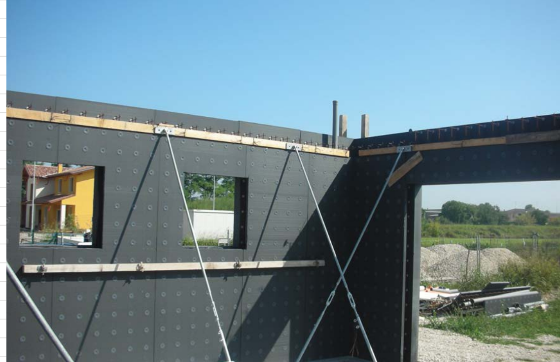
Tiraspingi in metallo

La tenuta piombo dei casseri si ottiene impiegando gli appositi tiraspingi, o qualsiasi attrezzatura che il costruttore ritenga adatta allo scopo.