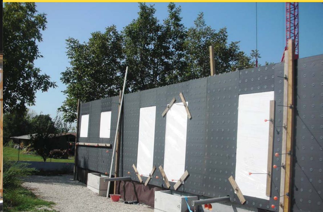
Casseri con blocchi a misura in EPS