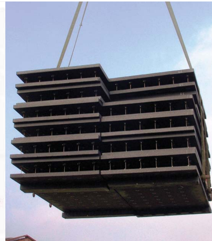
Scarico con gru

Misure da indicare per gli ordinativi dei casseri a) altezza lastra esterna b) altezza lastra interna c) altezza sottofinestra d) altezza esterna archit. e) altezza interna archit. f) altezza da massetto g) altezza luce finestra h) altezza sottofinestra da massetto i) luce finestra La lastra esterna del cassero senza veletta avrà la stessa misura della lastra interna in altezza