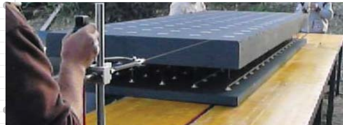
Taglio pannello cassero muro in cantiere