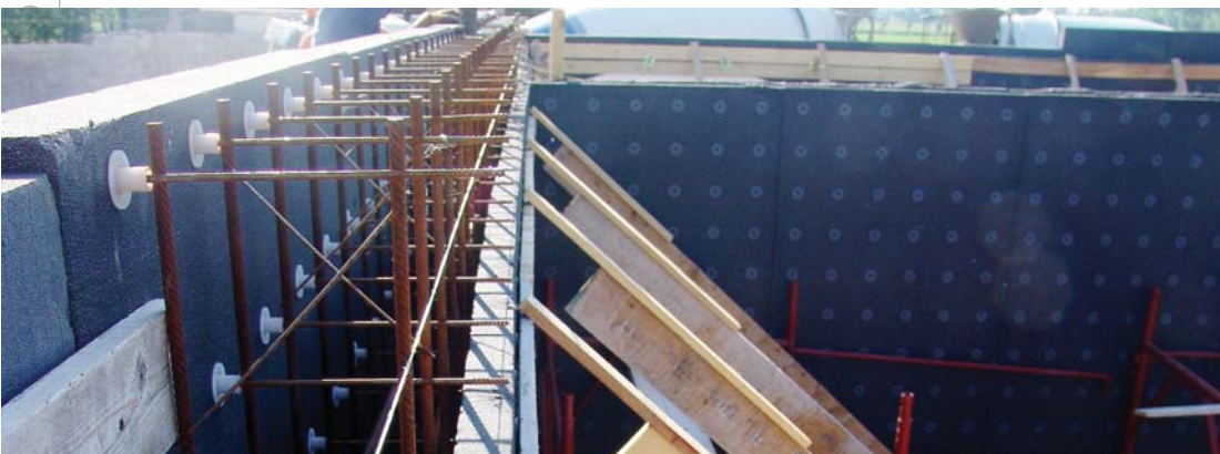
Particolare veletta per armatura solaio