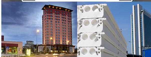
HOTEL HILTON FIRENZE Loc. San Bartolo a Cintonia