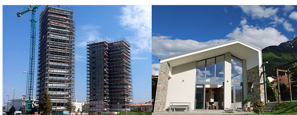
WAVE TOWER Jesolo